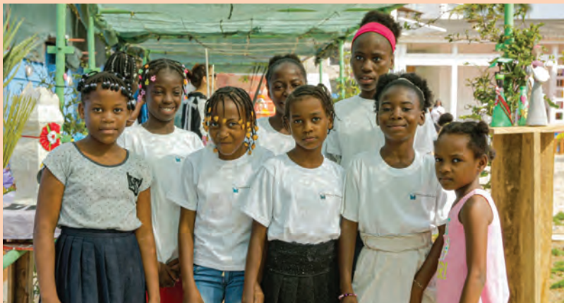
חניכות קרן הפונדסאו באירוע השקת המתנ"ס החדש

מאות ילדים ובני נוער, תושבי הקהילה המקומית ועשרות חברים נוספים הניח מהפעילויות. קרן הפונדסאו הוקמה בשנת 2006 בלואנדה, בירת אנגולה. המרכז הקהילתי של הקרן, שנמצא בלב שכונת מגורים, מאפשר לקיים מיזמים מגוונים בעלי נגיעה הוליסטית בחייהן של כל שכבות האוכלוסייה המקומית.