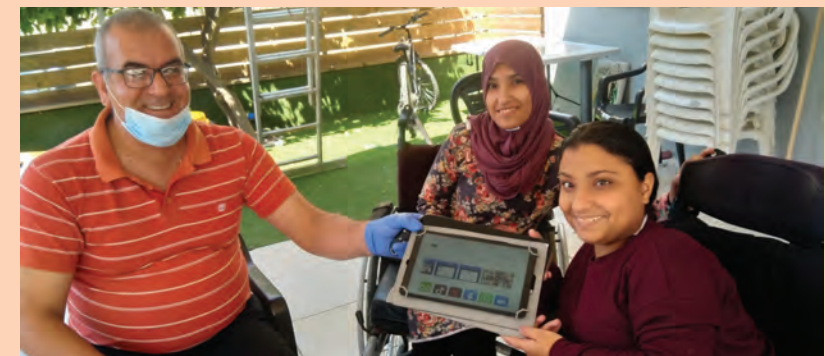
תרומת טאבלט ייעודי לחניכת בית הגלגלים

כמו כן, בשיתוף פעולה עם קבוצת מיטרלי, העברנו תרומות לעמותות בית הגלגלים, יד שרה ולתת, במטרה לסייע לאוכלוסיות נזקקות בהתמודדות עם התקופה הקשה. כספי התרומות איפשרו רכישת טאבלטים ייעודיים לאנשים עם צרכים מיוחדים, מכונות הנשמה ביתיות, ערכות לאשפוז ביתי עבור אוכלוסיית הקשישים וערכות חירום שכללו מזון, תרופות וציוד רפואי.