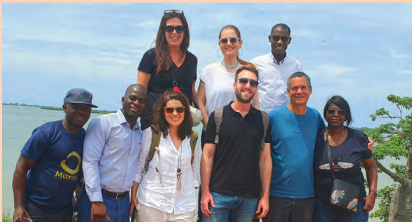
ביקור הכנה של צוות הסוכנות היהודית עם צוות מנומדין והפונדסאו באנגולה